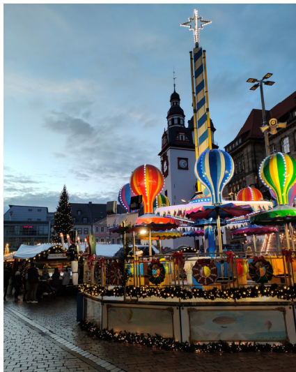
Фото присылайте на электронную почту: i-z.globus@web.de iryna-konst@mail.ru

Мы будем публиковать их на нашем сайте, а наиболее интересные – в газете.