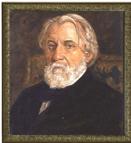
Ivan Sergeevich Turgenev

https://youtu.be/R0ha1KXFuKI https://youtu.be/mP9oURqVeXg