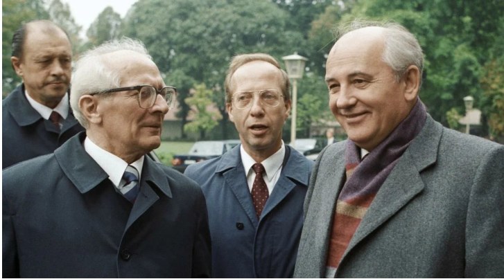
Erich Honecker und Michail Gorbatschow.

Für die deutsche Bevölkerung ist Michail Gorbatschow einer der berühmtesten und geschätzten Persönlichkeiten am Ende des 20. Jahrhunderts.