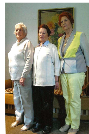
Достойная старость в Германии

Комендатуру сняли через 15 лет, в марте 1956 года. Но, несмотря ни на что, мы все «состоялись». Две сестры стали учителями математики, я защитила диссертацию по химии. Возможным это стало благодаря большой целеустремленности, усердию и... добрым людям, которые встречались на нашем пути.