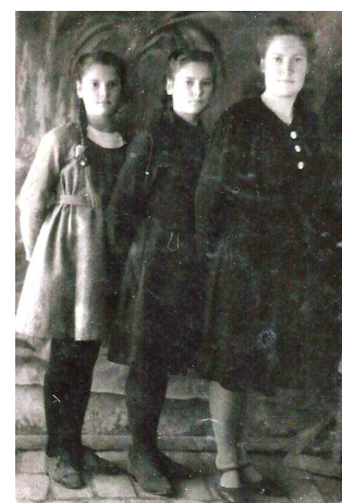
Такими мы пошли в школу