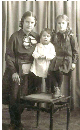
Такими нас выслали

можно быть отличницей. И я сразу решила: буду! В первые же дни было классное собрание, выбирали классный совет и старосту. Как положено, выбрали президиум. И я поняла, что непременно хочу в президиум, хочу в совет. Но с этим было сложнее. Меня и потом всю жизнь «не выбирали», «не выдвигали», «не утверждали»... Пятая графа в паспорте не соответствовала.