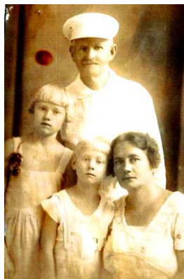
Родители и младшие дети