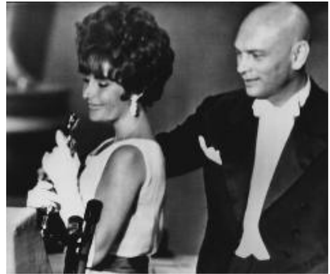
Юл Бриннер вручает «Оскара» Элизабет Тейлор

...В апреле 1983 года во время гастролей в Сан-Франциско Юл Бриннер обратился к медикам, и они обнаружили у него рак лёгких. Юл был заядлым курильщиком и выкуривал до 3-х пачек сигарет в день. Болезнь уже невозможно было вылечить, она прогрессировала. Актёр испытывал страшные боли, но продолжал выступать. И никто, кроме его партнёров по сцене, не знал о том, какие муки он испытывает.