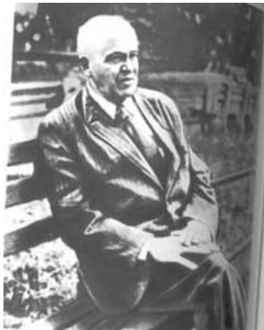
Роман Гуль в Америке

Но в голодном, разорённом войне Киеве оставалась мать. Невозможно спокойно читать, как немолодая уже и серьёзно больная женщина шла пешком из Киева через польскую границу – в Германию. Где её никто, кроме сыновей, собственно, и не ждал. Где ей отказали в виде на жительство – границу-то она перешла нелегально!