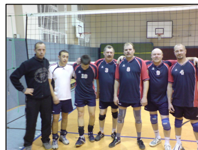
SG Moskau II

«Маккаби» выступила в этом сезоне наиболее удачно, и выполнила программу- максимум, заняв II место в своей группе. В случае удачных выступлений в переходных играх, команда может подняться на одну ступеньку выше, а именно в III Лигу.