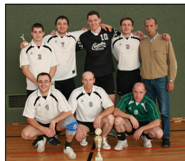
SG Moskau I

Команда SG Moskau II, выступающая в 4- В лиге, в этом сезоне не смогла собраться полным составом на большинство игр.