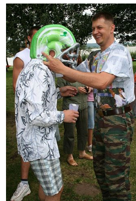
Приз вручается лучшему принимающему